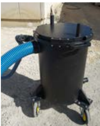
Dispositivo de filtração portátil - 50 litros / minuto usando uma bomba de transferência