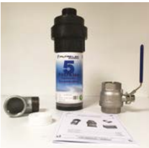
Vazão: 5 litros / minuto por gravidade

FILTRELEC® é uma alternativa técnica e econômica aos separadores físicos tradicionais de óleo / água.