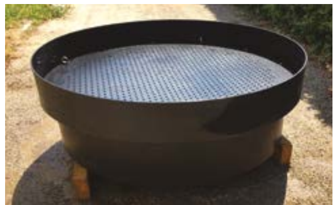
Vazão: 1500 litros / minuto por gravidade